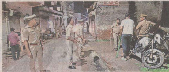
एत्मादौला के नगला देवजीत में हंगामे की सूचना पर पहुंची पुलिस • जागरण

जासं, आगरा: एत्मादौला के नगला देवजीत में मंगलवार रात चाय पीने के दौरान 50 साल के हिंदू और मुस्लिम दोस्त आपस में भिड़ गए। दोनों के स्वजन आमने-सामने आ गए। सही समय पर पहुंची पुलिस ने दोनों पक्षों को खदेड़ा। मौके पर लगे सीसीटीवी की डीवीआर कब्जे में ली है। सुबह पीस कमेटी की बैठक में आए एक संभ्रांत युवक की सूचना के चलते बड़ा विवाद होने से रुक गया।